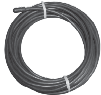
Suitable sensors: see page 20 Empfohlen Fühler: siehe seite 20